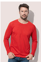
ST2500 Classic-T Long Sleeve