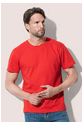
ST2100 Comfort-T 185