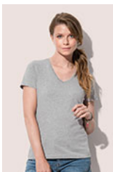
ST2700 Classic-T V-neck