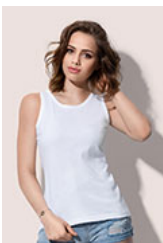
ST2900 Classic Tank Top