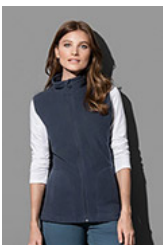
ST5110 Fleece Vest