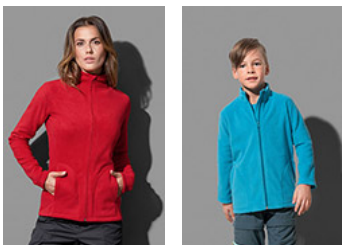
ST5100 Fleece Jacket ST5170 Fleece Jacket Kids