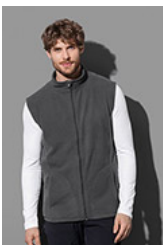
ST5110 Fleece Vest