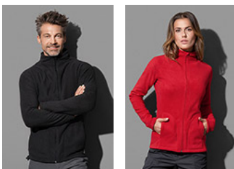
ST5030 Fleece Jacket ST5100 Fleece Jacket