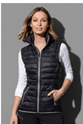
ST5310 Padded Vest