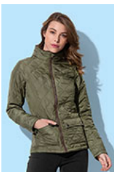
ST5360 Quilted Jacket