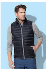
ST5210 Padded Vest