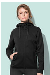
ST5940 Recycled Scuba Jacket