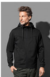
ST5840 Recycled Scuba Jacket