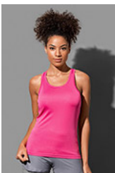
ST8110 Sports Top