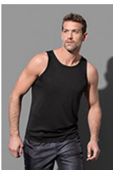
ST8010 Sports Top