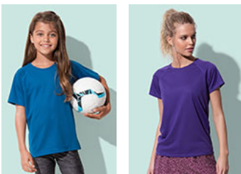
ST8570 Active 140 Raglan Kids ST8500 Active 140 Raglan