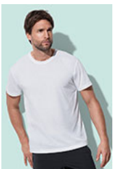
ST8600 Cotton Touch