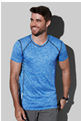
ST8840 Recycled Sports-T Reflect