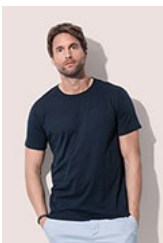
ST9100 Finest Cotton-T