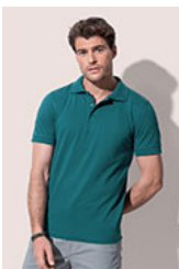
ST9060 Harper Polo