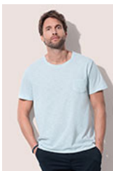
ST9450 Shawn Oversized Slub