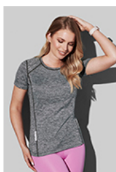
ST8940 Recycled Sports-T Reflect