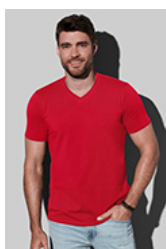
ST9610 Clive V-neck