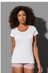
N1100 Nano women