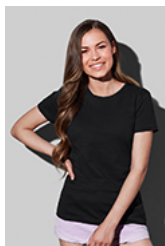
ST2600 Classic-T Fitted