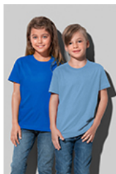
ST2200 Classic-T Kids