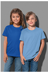
ST2200 Classic-T Kids