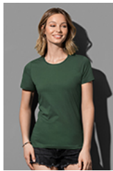
ST2600 Classic-T Fitted