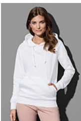
ST4110 Sweat Hoodie Classic