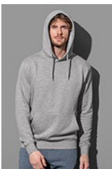
ST4100 Sweat Hoodie Classic