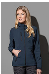
ST5330 Softest Shell Jacket