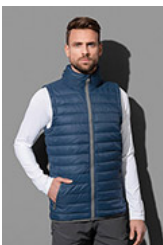
ST5210 Padded Vest