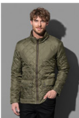
ST5260 Quilted Jacket