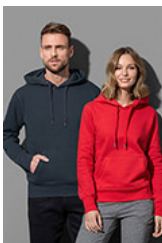
ST5600 Unisex Sweat Hoodie Select