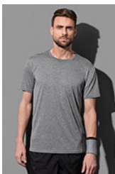
ST8830 Recycled Sports-T Move