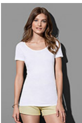
ST9110 Finest Cotton-T