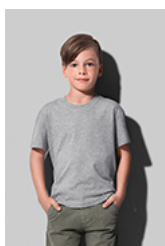
ST2220 Classic-T Organic